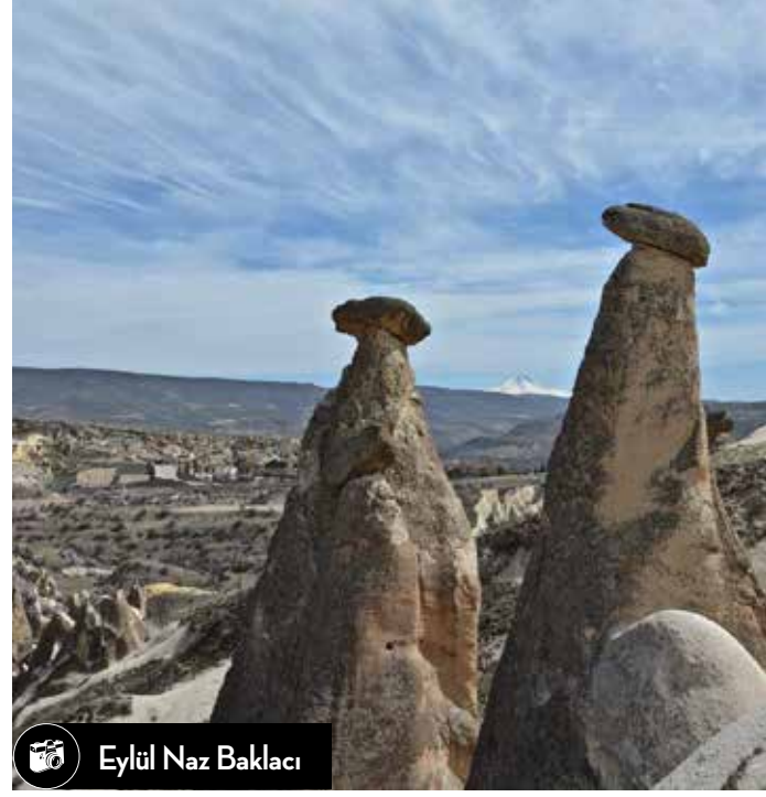
Eylül Naz Baklacı